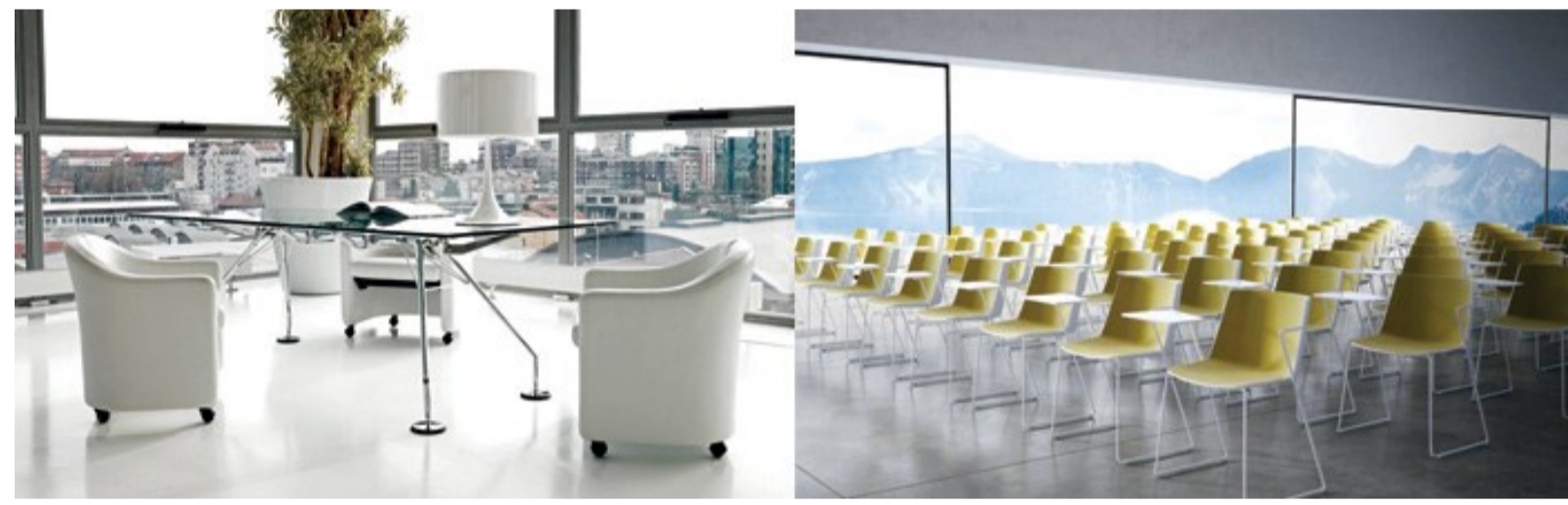
Aiku, by Jean Marie Massaud per MDF Italia e tavolo Nomos + poltroncine PS142 di Tecno